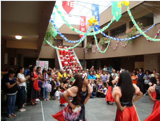
Apresentação Cultural no Centro Social Marelo 90 anos da Província - Curitiba PR - 24/10/2009